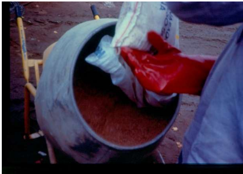
(Figura 18, a)

Por último, se debe distribuir el cebo en cobertura total a mano o mediante espolvoreadora mecánica; y repetir la aplicación en caso de lluvia.