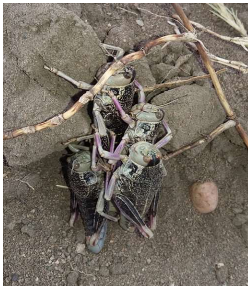
Figura 4. Grupo de tucura sapo adulto en la estepa patagónica (Cushamen).