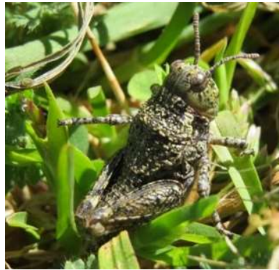
Figura 11, (a) y (b). Ninfas de tucura sapo.