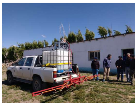
Figura 14. Aplicación por medio de pulverizadora montada en camioneta (Fuente: INTA AER Gobernador Costa).

b. Pulverizadoras terrestres : El tratamiento podrá realizarse en aplicación directa utilizando productos registrados y/o autorizados para tal fin mediante pulverizadoras montadas en camionetas y/o cuatriciclos. (Figuras 14 al 17).