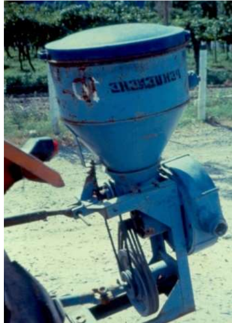
Figura 18: (a) y (b) Método de preparación y (b) y (c) distribución de cebo tucuricida.

e. Enemigos y alternativas de control : Mamíferos, reptiles y aves insectívoras actúan como reguladores naturales de la población de tucuras. Se ha identificado, mediante monitoreos, la presencia de aves que consumen tucuras como loica común, tero, sobrepuesto común, choique, becasina común, bandurria, cachirla común, pico de plata, gaucho serrano y aves de corral.