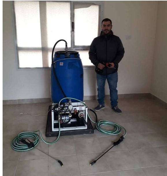
Figura 17. Pulverizadora para pick up, armado propio.

c. Cañones o lanzas : El tratamiento podrá realizarse en aplicación directa utilizando productos registrados y/o autorizados para tal fin (Figura 17).