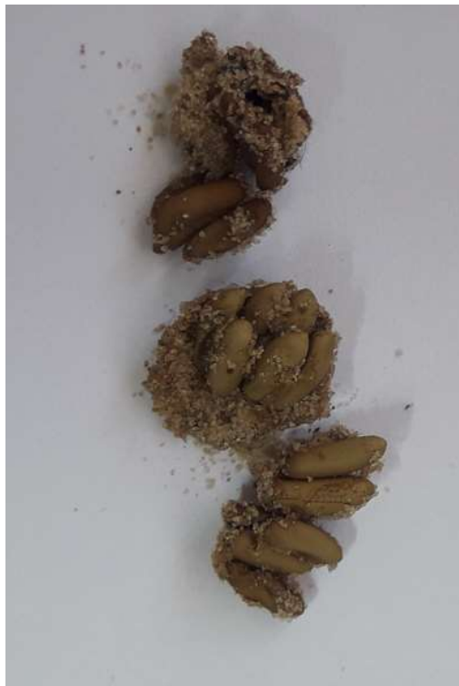
Figura 8. Huevos de tucura sapo (Fuente: Dr. a Yanina Mariottini - CONICET, CCT Tandil).