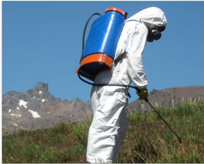
Figura 20:(a) y (b) Elemento de protección personal (EPP) que tiene que utilizar el aplicador al momento de pulverizar o distribuir el cebo tucuricida (Fuente: (a) INTA EEA Bariloche y (b) Ing. Francisco Azzaro, Senasa).