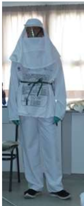
(Figura 20, a)