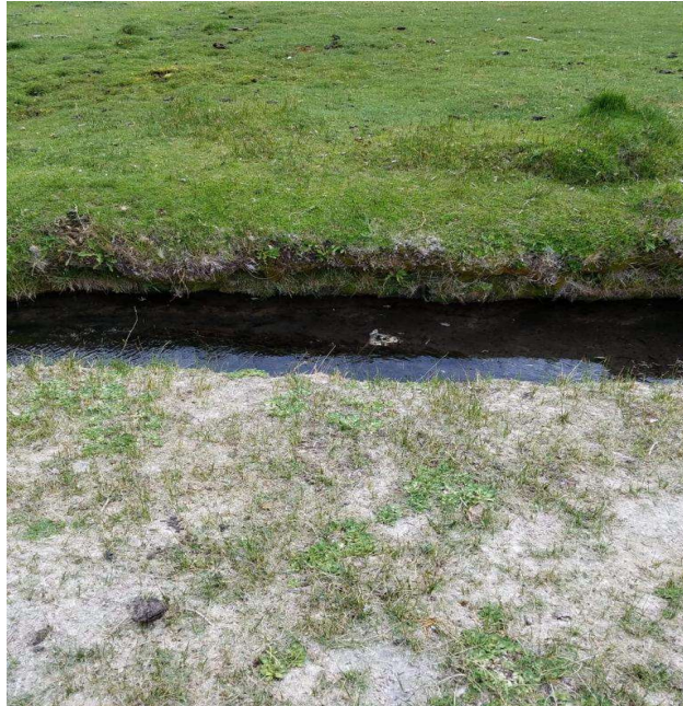
Figura 2. Zona afectada por tucura y zona no afectada por tucura, las separa un curso de agua en Santa Cruz.