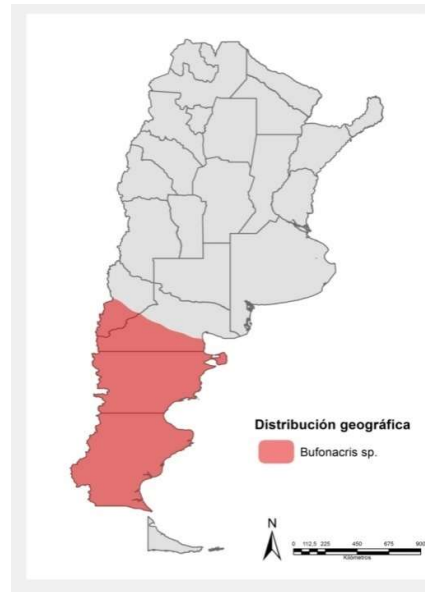
Figura 1. Distribución de Tucura saop . Fuente: Senasa adaptado de Carbonell et al., 2006 2

Es una especie univoltina que presenta diapausa embrional, es decir que pasa el otoño/invierno en estado de huevo bajo tierra. Entre fines de invierno y principios de primavera se producen los primeros nacimientos de ninfas que avanzarán en su desarrollo hasta convertirse en adultos. Asimismo, es una especie polífaga ( i.e. se alimenta de distintas especies de plantas) y áptera ( i.e. no posee alas), por lo cual no puede volar.