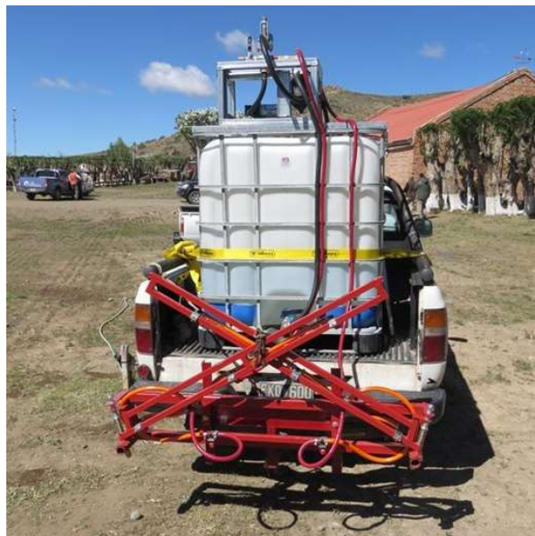
Figura 15. Camioneta adaptada para cargar una pulverizadora.