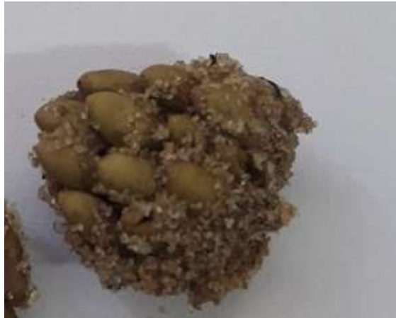
Figura 9. Huevos obtenidos de una ovipostura (Fuente: Dr. a Yanina Mariottini- CONICET, CCT Tandil).