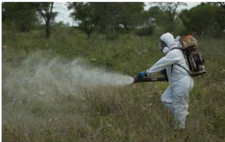
Figura 13. Motomochilas: Permiten un control con bajo impacto en el ambiente, su aplicación es de corta distancia y por lo tanto muy localizada.

b. Pulverizadoras terrestres : El tratamiento podrá realizarse en aplicación directa utilizando productos registrados y/o autorizados para tal fin mediante pulverizadoras montadas en camionetas y/o cuatriciclos. (Figuras 14 al 17).