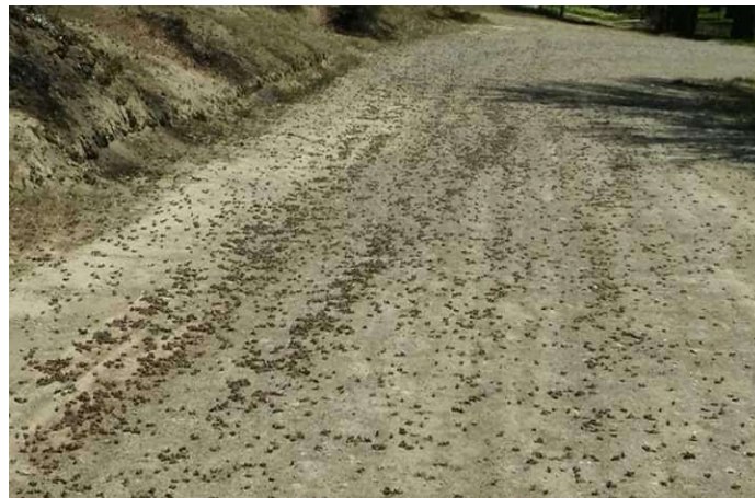
Figura 3. Adultos de tucura sapa en la Localidad de Tecka (dentro del pueblo).