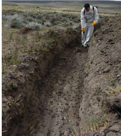
Figura 19. Zanja (control mecánico) para impedir el ingreso de las tucuras a las zonas urbanas y pulverización en la zanja en Cushamen.