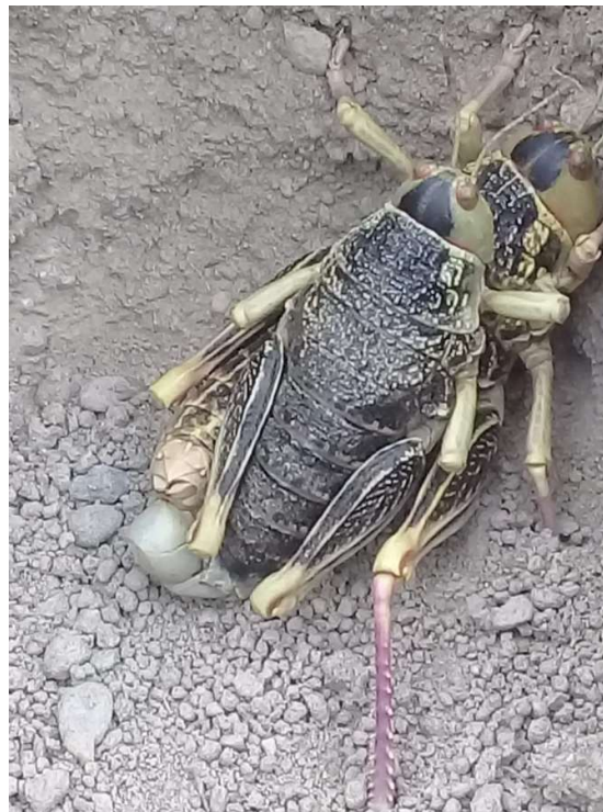
Figura 10. Tucura sape adultos copulando (apareándose). Se observa al macho (menor tamaño) arriba de la hembra (mayor tamaño) (Cushamen, Chubut).