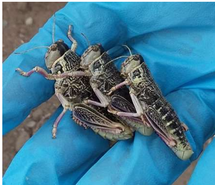
Figura 12. Colecta de tucura sapo adulto en el campo, una hembra (mayor tamaño) y dos machos (menor tamaño) (Fuente: Dr. a Valeria Fernández Arhex, IFAB INTA-CONICET).