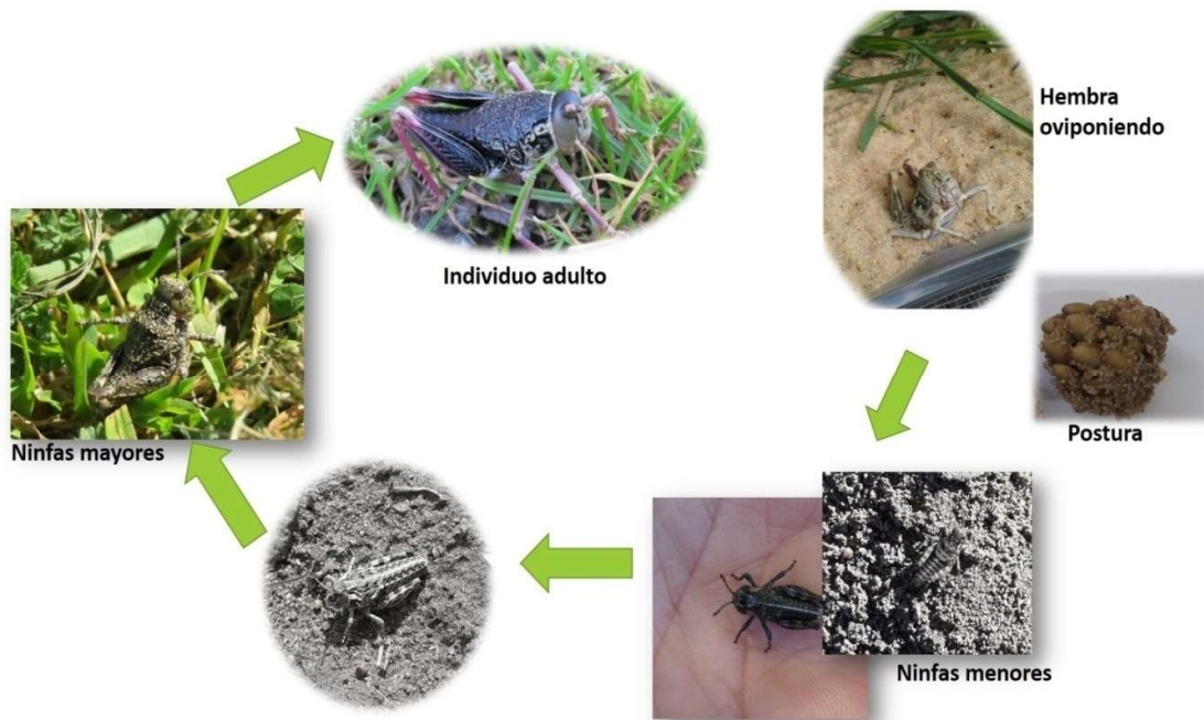
Figura 7. Ciclo de vida general de tucura sapa (Fuente: Dr. a Yanina Mariottini - CONICET, CCT Tandil).