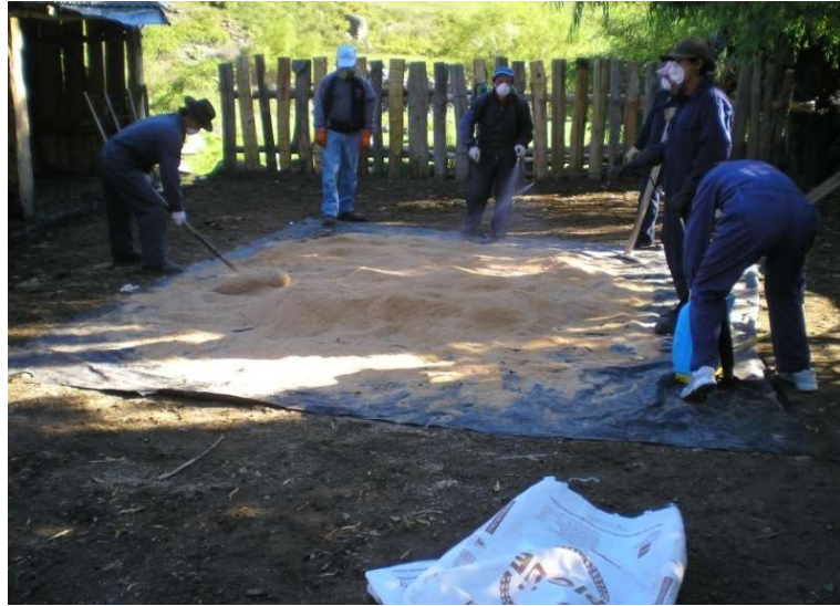
(Figura 18, c)